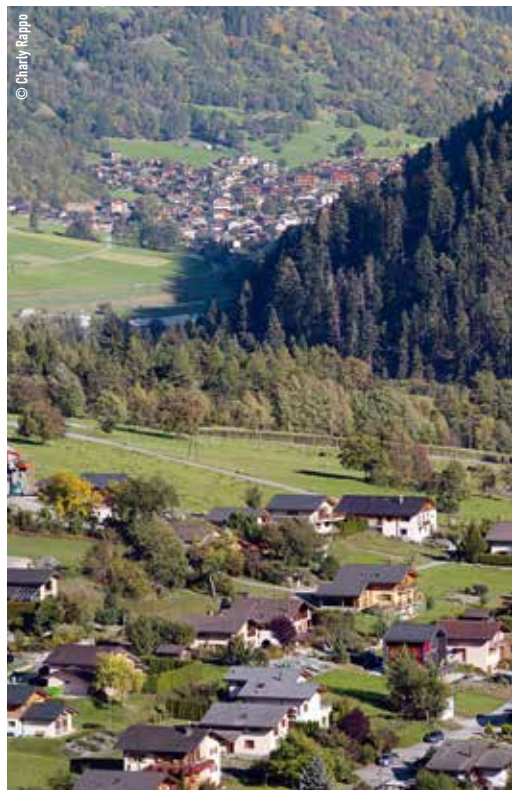
En 2021, Bagnes et Vollèges pourraient ne faire plus qu'une seule commune.

En 2019, les Bagnards et les Vollègeards devraient pouvoir se prononcer sur la fusion de leurs communes. Avant cela, au printemps 2018, toutes les citoyennes et tous les citoyens de Bagnes seront invités à participer à des rencontres pour donner leur avis sur les différents aspects de la fusion.