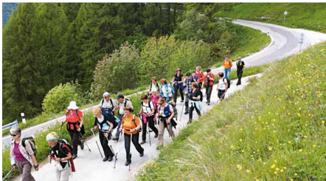
Le groupe Edelweiss en balade au-dessus d'Evolène

POUR TOUTE INFORMATION COMPLÉMENTAIRE, contacter Nathalie Humbert à Pro Senectute Valais, 027 322 07 41.