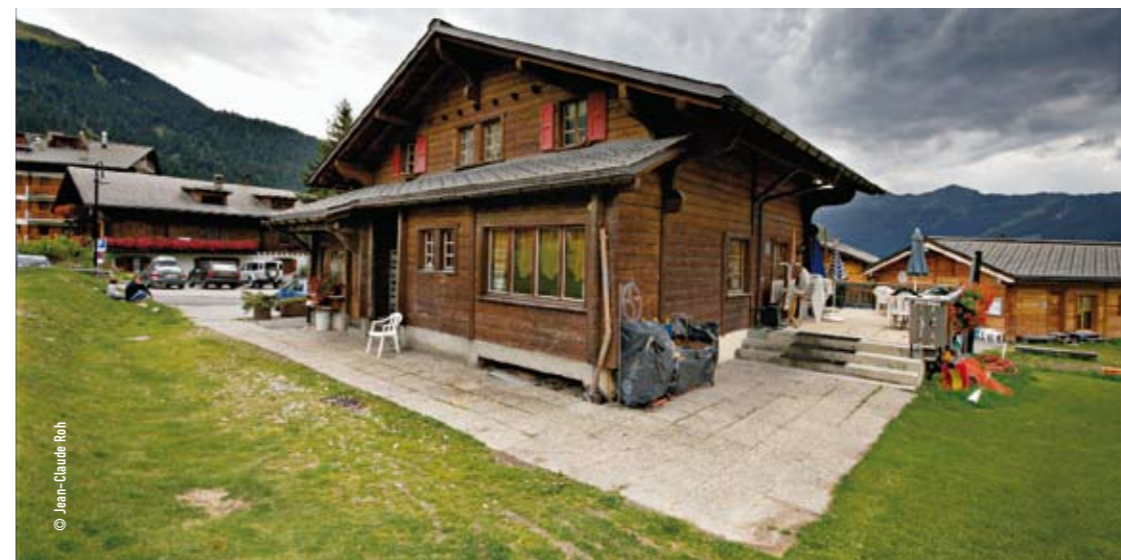
La buvette des Moulins a pris un coup de vieux. Site privilégié au cœur de Verbier, l'espace sera complètement réaménagé.

La Commune a lancé les commandes d'avant-projet de la chapelle ardente du Châble, de la salle des fêtes de Saint-Marc et de l'espace des Moulins à Verbier. Elle attend les rendus des architectes pour novembre. Les chantiers pourraient débuter quasi simultanément au printemps 2010.