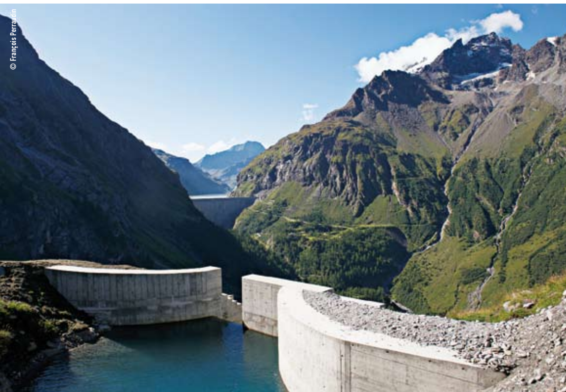
Le barrage de Mauvoisin fait partie du patrimoine des citoyens de Bagnes. Une partie de la plus-value qu'il génère pour la commune permettra de conserver un tarif de l'électricité très attractif.