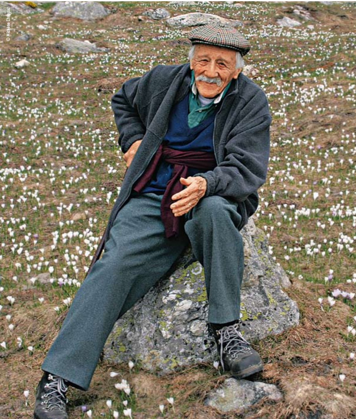
Maurice Chappaz sur le chemin du bisse de Verbier sous la Tournelle

A 92 ans, Maurice Chappaz s'apprête à publier un nouvel ouvrage «La pipe qui prie et fume». Une exposition sera consacrée à son livre au Musée de Bagnes cet hiver. On pourra y découvrir les œuvres de Pierre-Yves Gabioud, dont certaines ont été choisies pour accompagner les pages du livre de Maurice Chappaz.