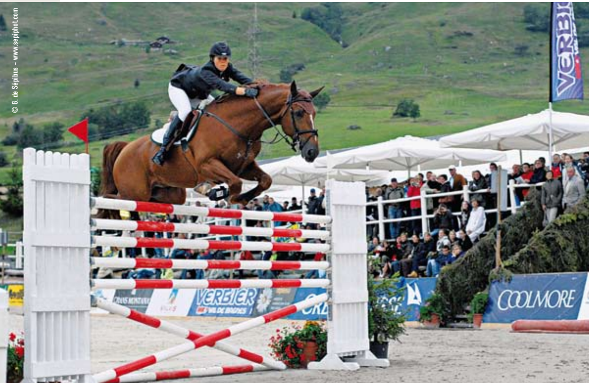
Le succès du concours hippique ne se dément pas. La manifestation a accueilli cet été quelque 30'000 visiteurs.

Le référent Fiesta pour la Commune est la police municipale. C'est elle qui, au final, décide de l'attribution du label. Avec les concours des coordinateurs d'événements, la police examine la pertinence de labelliser une manifestation, prend contact avec les organisateurs et leur explique une démarche qui se veut résolument accompagnatrice et qui, de fait, est généralement accueillie de façon très positive. La police municipale ouvre un dossier, elle centralise contrats, autorisations ou lettres d'intention et elle aide les organisateurs à se conformer au carnet de route. A l'ouverture de la manifestation, les agents municipaux vérifient que l'organisateur s'est bien conformé à ses engagements puis, durant toute la durée de l'événement, procèdent à des visites régulières du site. Enfin, la fête terminée, la police rencontre l'organisateur pour un débriefing qui facilitera la reconduction de l'événement l'année suivante. Nicolas Gay-Balmaz