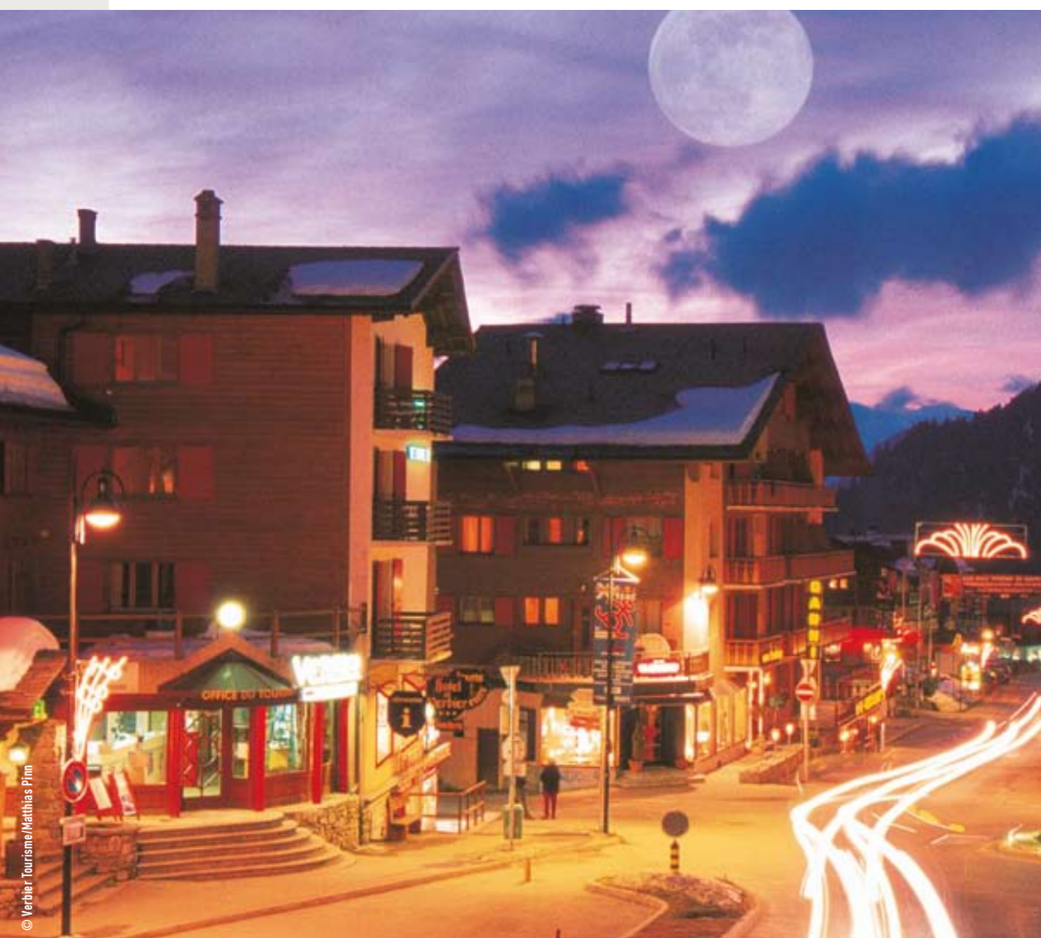
Du nouveau pour l'attractivité touristique: La nouvelle région touristique Verbier/Saint-Bernard est née le 9 septembre 2008. La signature du contrat liant les cinq communes (Bagnes, Orsières, Liddes, Bourg-Saint-Pierre et Riddes) et les cinq sociétés de développement concernées (Verbier, Châble/Bruson, Fionnay/Haut Val de Bagnes, Pays du Saint-Bernard et La Tzoumaz) en marque le premier acte concret.