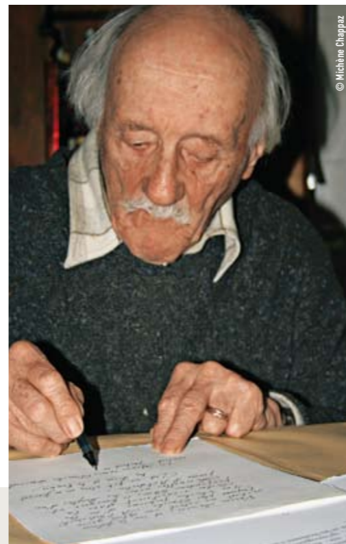
Maurice Chappaz au travail à l'Abbaye

le bon m'assure-t-il. «Venez, je vais vous montrer à quoi ressemble ce livre». Conduite dans son antre, je contorne les piles de livres et de papiers qui entourent le bureau de l'écrivain. Une pièce tout droit sortie d'un film. Une immense table recouverte d'enveloppes où court une écriture fine, la sienne. Des portraits, des peintures, des photographies de famille complètent le décor. Et là, par terre, gît le manuscrit de «La pipe qui prie et fume». Un carton de fruits et légumes rempli à ras bord de papiers divers, corrigés et annotés. Retour sur le canapé, au beau milieu des livres qui colonisent également la pièce. La lumière baisse, il se fait tard. Derrière les vitres de l'Abbaye, la tempête se déchaîne, ajoutant à l'irréel. On n'interviewe pas Maurice Chappaz. Impossible de dresser une liste de questions et d'en attendre des réponses. La personnalité de l'écrivain transforme l'exercice en discussion, en rencontre, en partage. Il faut dire que l'homme excelle dans l'art de retourner les questions à son expéditeur.